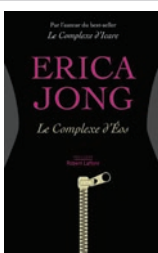
LE COMPLEXE D'EOS Erica Jong