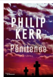
PÉNITENCE Philip Kerr